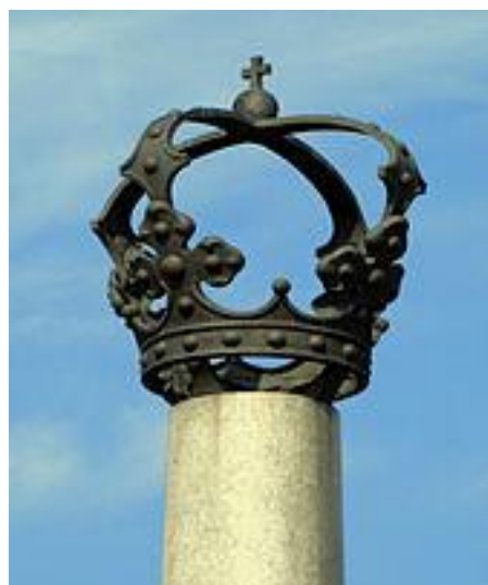
Pomnik Electio Viritim u zbiegu ulic Jana Ostroroga i Obozowej, w miejscu dawnego pola elekcyjnego.

Szczególnego znaczenia nabrała Wola w drugiej połowie XVI stulecia, kiedy to decyzją sejmu konwokacyjnego 1 , jako miejsce stałych elekcji królów polskich uznano błonia pod wsią Wola. Wówczas stała się ona miejscem znanym nie tylko w okolicach Warszawy, ale w całej Polsce, a także za granicą. To właśnie tu formowały się zasady europejskiej demokracji, a szlachta wybierała panującego króla! Elekcje królów polskich na terenach Woli odbywały się do 1794 roku.