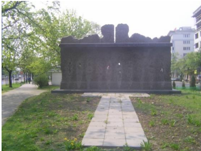
Pomnik Pamięci Ludności Woli Wymordowanej w Czasie Powstania 1944

W historii Woli nie można także zapomnieć o bardzo smutnych, ale i bardzo ważnych wydarzeniach, jakie miały miejsce w czasie II wojny światowej.