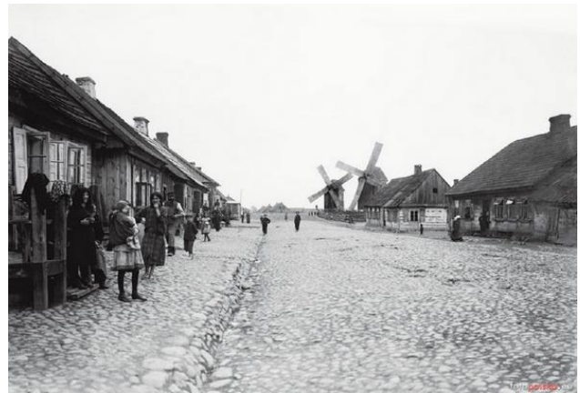
1916 Ulica na Młynowie