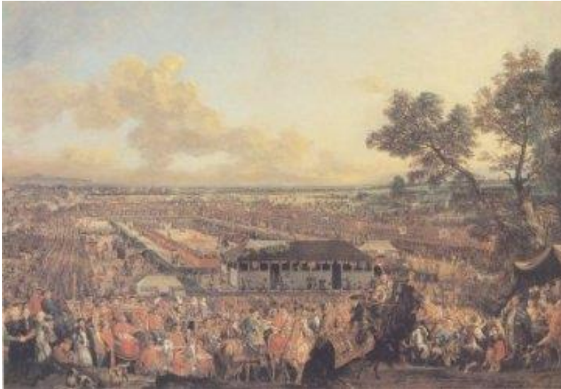
Elekcja królewska na Woli w XVIII w. (Obraz Canaletta)

Na pamiątkę tych wydarzeń, tworzenia kół wyborczych, miejsca obozów postów czy swobód szlacheckich nazwę nosi wiele wolskich ulic: Koło, Elekcyjna, Obozowa, Wolność.