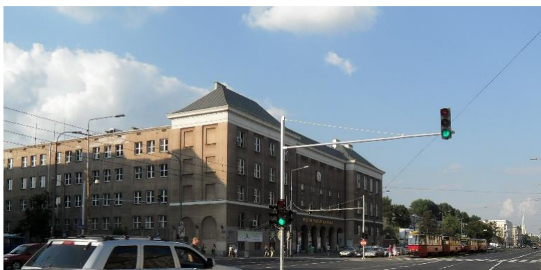
Urząd Dzielnicy Warszawa Wola