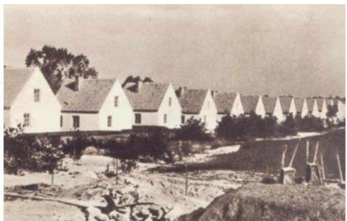
Osiedle domków na Kole

W pierwszych dniach Powstania Warszawskiego wojska niemieckie gwałtownie uderzyły na Wolę będącą zachodnią tarczą Warszawy. Odważni, lecz słabo uzbrojeni powstańcy nie byli w stanie powstrzymać nieprzyjaciela dysponującego bronią pancerną, artylerią i lotnictwem. Na zajętych przez Niemców terenie rozpoczęła się rzeź mieszkańców Woli. W ciągu kilku dni zbrodniarze wymordowali ok. 50 tys. mieszkańców dzielnicy: mężczyzn, kobiet i dzieci.