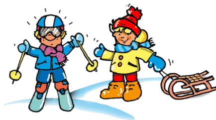
Igor Gładowski kl. IIIc

W czasie ferii pamiętajcie jednak o bezpieczeństwie zabaw zimowych!