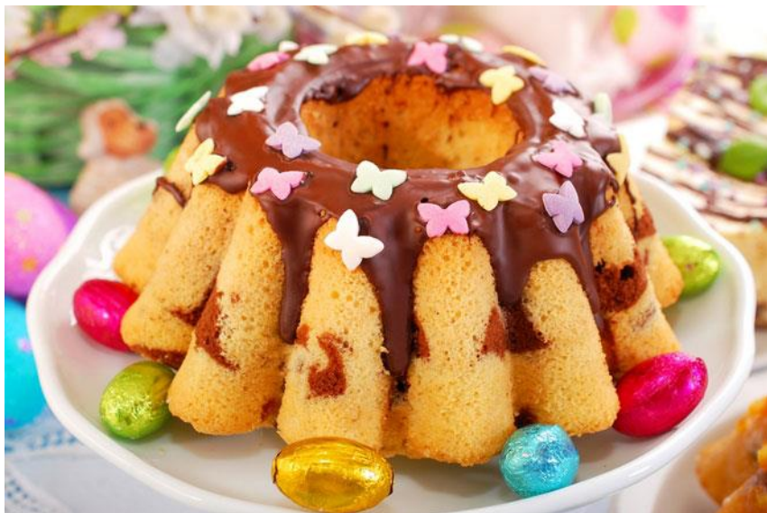
Przepisy wyszukała: Katarzyna Bugała kl. 3a

Foremkę na babkę wysmarować masłem i wysypać bułką tartą. Przełożyć łyżką ciasto i wyrównać powierzchnię. Babkę piaskową piec 1godzinę w temperaturze 175 stopni C. Przystudzić, wyjąć z formy i posypać cukrem pudrem.