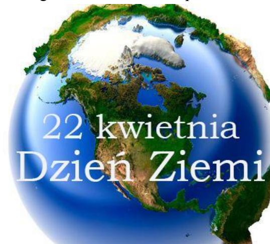
Opracowała: Helena Ciesielska kl. 3 a

22 kwietnia obchodzimy Międzynarodowy Dzień Ziemi, znany też jako Światowy Dzień Ziemi. Z tej okazji corocznie wiosną prowadzone są akcje, których celem jest promowanie postaw ekologicznych w społeczeństwie. Organizatorzy Dnia Ziemi chcą uświadomić politykom i obywatelom, jak kruchy jest ekosystem planety ludzi. Na obchody składa się zwykle wiele wydarzeń organizowanych przez różnorodne instytucje. Korzenie Dnia Ziemi wiążą się z obserwacją przesilenia letniego, będącą okazją do wykorzystania sprzyjającej aury, która ma ułatwić zorganizowanie udanych imprez masowych. Pamiętajmy o Ziemi, bez naszego zaangażowania Ziemia nie przetrwa!