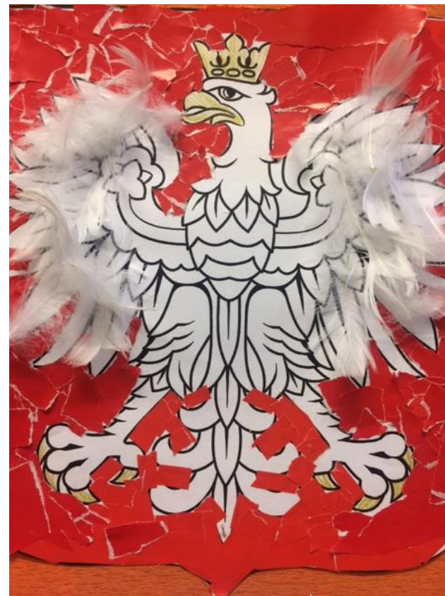
Aleksandra Skiba klasa 3c