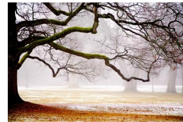
Bartek Wileński klasa 3b